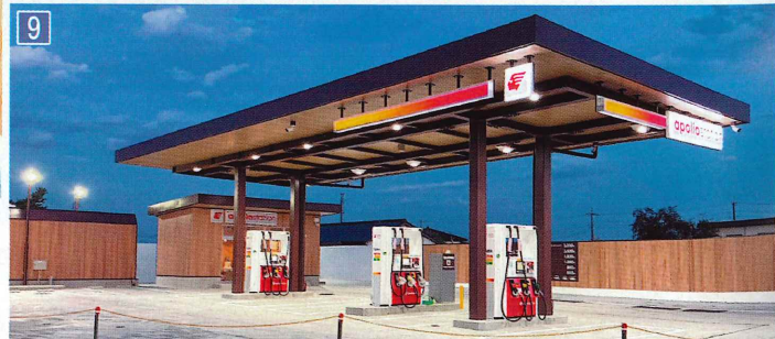
1 2 3 ドライブスルー洗車を案内 4 セルフ灯油コーナー 5 テープカット式典 6 7 初給油の儀に臨んだ後、策定したスローガンを公表した 8 イベント期間は10日間(8月3~12日)を設け、オープン後の集客に弾みをつけた 9 前面道路(県道桐生伊勢崎線)は近々、中央分離帯を設置予定(左折進入・左折退出の動線を描く)